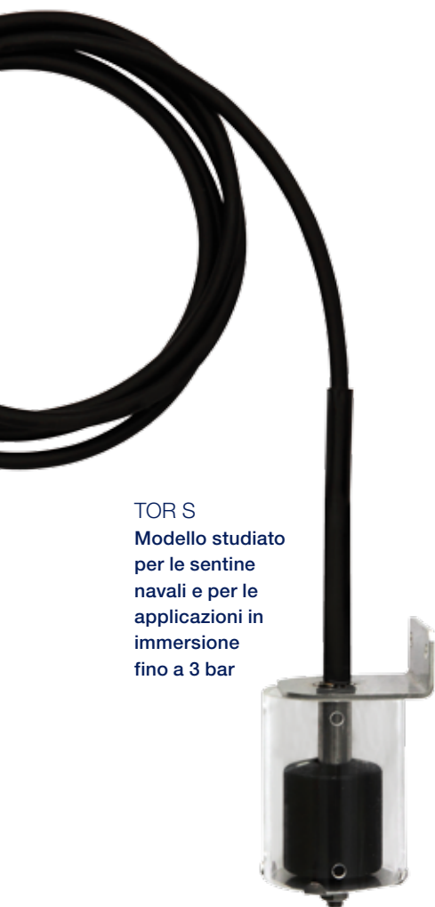
TOR S Modello studiato per le sentine navali e per le applicazioni in immersione fino a 3 bar