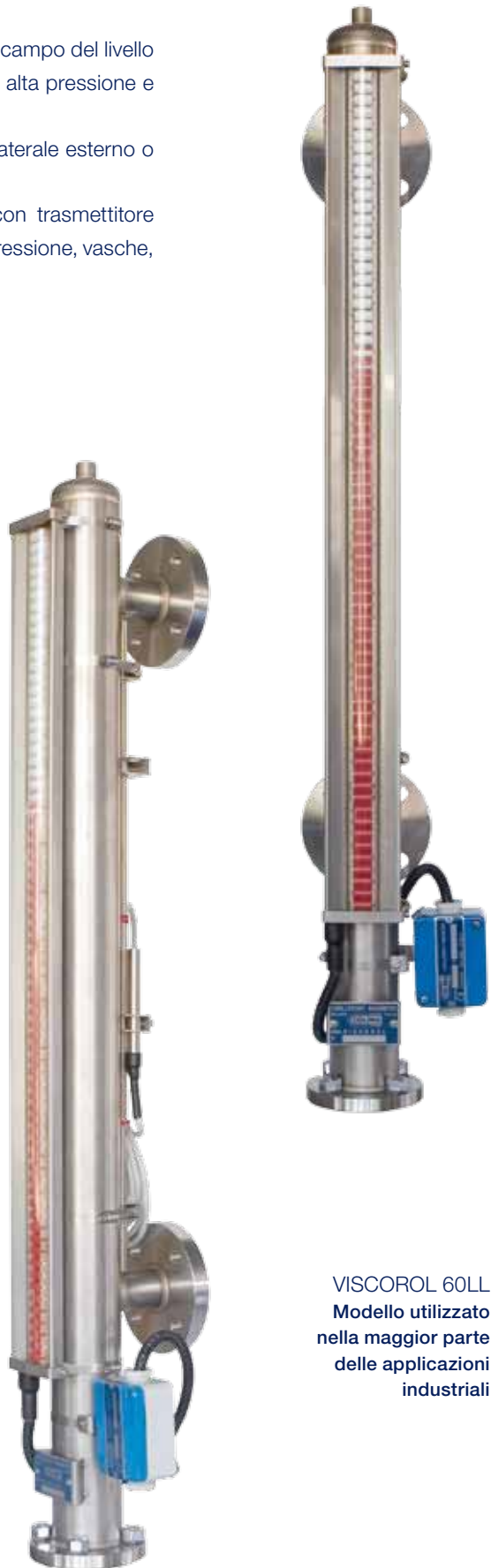
VISCOROL 60LL Modello utilizzato nella maggior parte delle applicazioni industriali

Omologazione RINA e Marina Militare Italiana