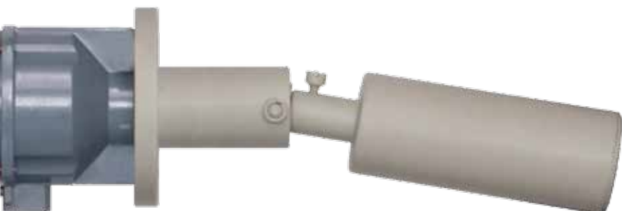
MEC A in PVC

Modello base idoneo per applicazioni generali