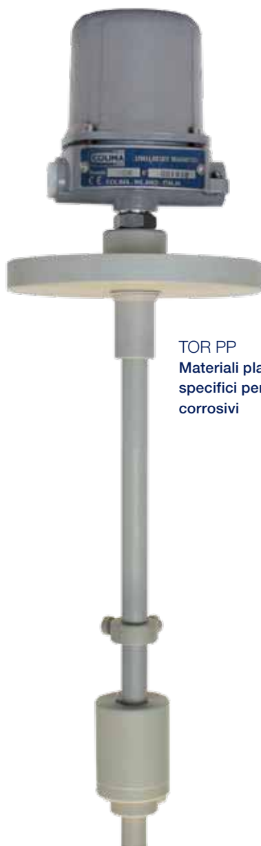
TOR PP Materiali plastici specifici per fluidi corrosivi

Omologazione RINA, Lloyd's Register e Marina Militare Italiana