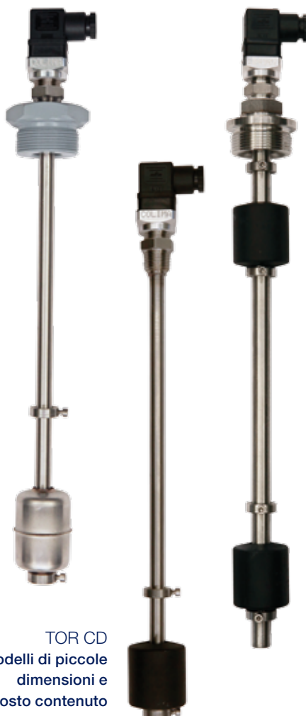
TOR CD Modelli di piccole dimensioni e costo contenuto