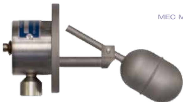
MEC MINI Modello di piccole dimensioni e costo contenuto