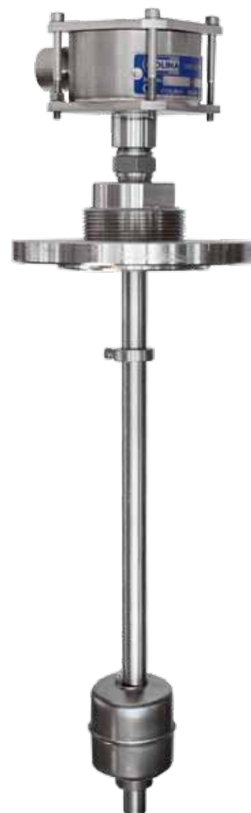
TOR A Modello interamente in acciaio inox, per ambienti corrosivi