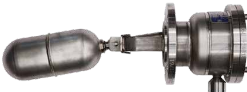
MEC A IP68 Interamente in acciaio inox, idoneo per impianti sottoposti a lavaggi o per ambienti altamente corrosivi