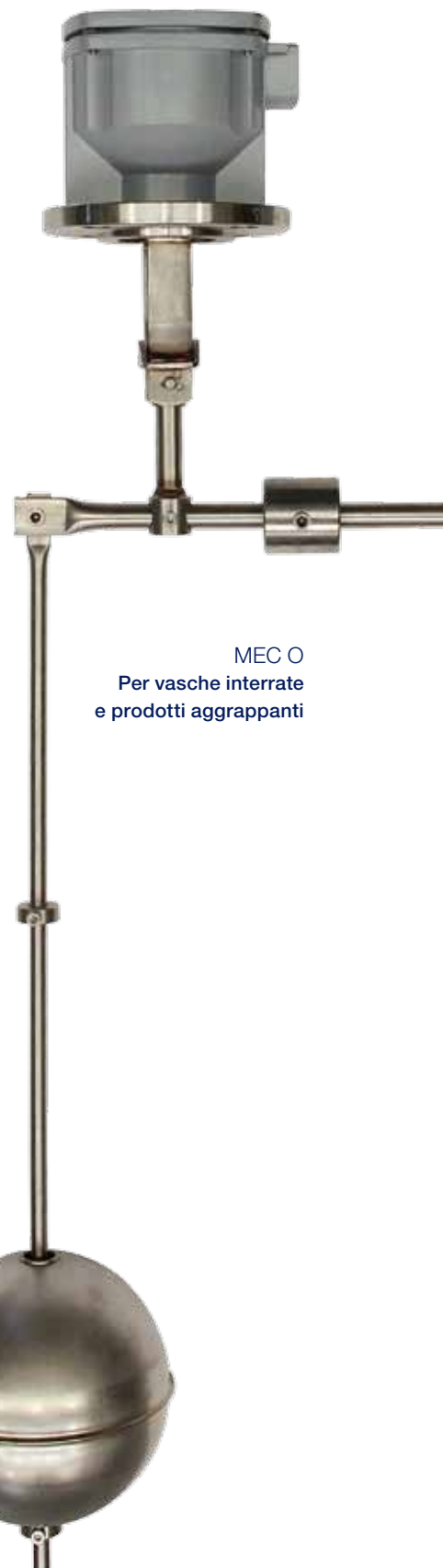
MEC O Per vasche interrante e prodotti aggrappanti